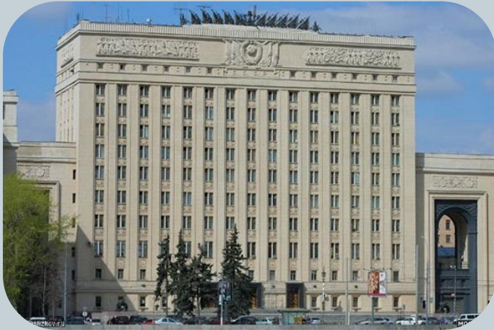
Здание Министерства Обороны на Фрунзенской набережной