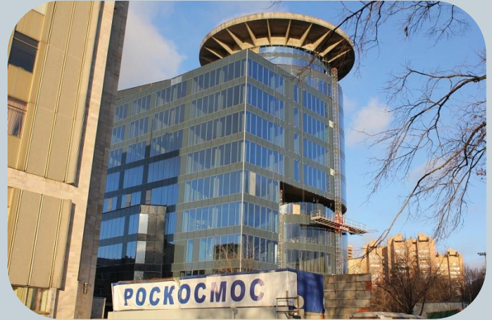
Административное здание РОСКОСМОСА