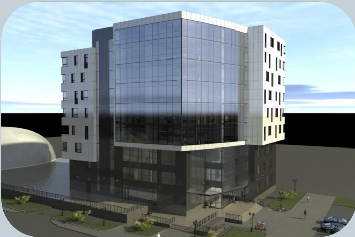
Офисный центр г. Мытищи, ул . Колпаково , дом 24